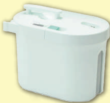
スカットクリーン (本体)