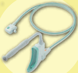
女性用 レシーバーセット