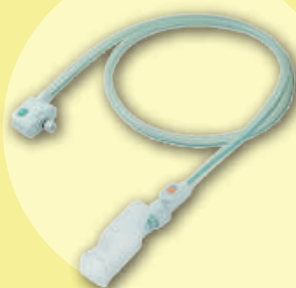
男性用 レシーバーセット